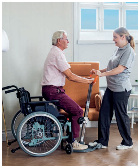
Un transfert en toute sécurité qui permet un contact visuel et une bonne communication : rassurant pour les deux participants.