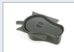
Réf. : 56-209 Bassin avec couvercle