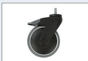
Réf. : 56-359 Roue avec blocage directionnel Diamètre : 125 mm