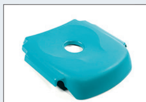
Réf. : 56-205 Assise de douche en plastique vert