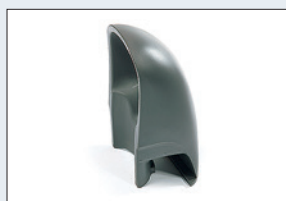
Réf. : 56-213 Pare-éclaboussures