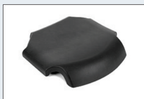
Réf. : 56-236 Coussin plein confort