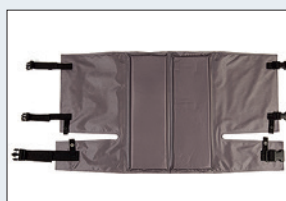
Réf. : 56-258 Dossier SoftBack