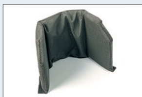
Réf. : 56-216 Coussin avec appuis latéraux