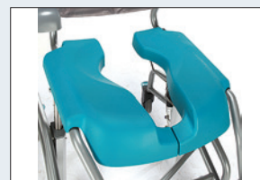
Réf. : 56-234 Assise souple en PU en 2 parties