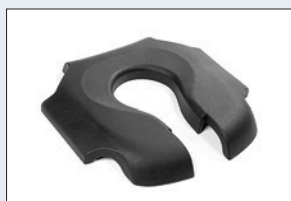
Réf. : 56-206 Coussin confort