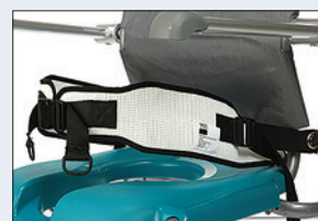
Réf. : 56-217 Ceinture