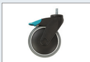
Réf. : 56-361 Roue avec frein Diamètre : 125 mm