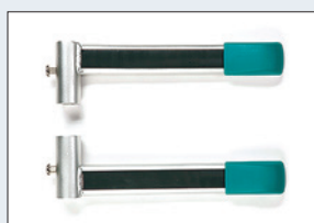
Réf. : 56-221 Kit d'élargissement accoudoirs (+ 5 cm)