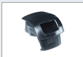
Réf. : 56-232 Bouchon pour siège souple (56-206)