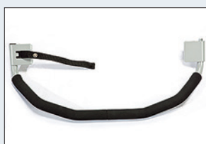
Réf. : 56-212 Barre de sécurité