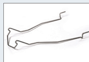
Réf. : 56-218 Support bassin